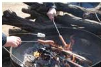
磯沼ミルクファーム